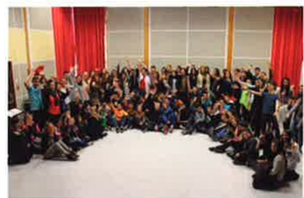
10 avril 2015 - Châteaumeillant : Léz'Arts O Collège : «Partition onomatopéique»