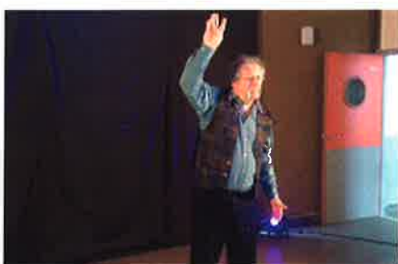
29 mars 2015 - Châteaumeillant EHPAD : Matinée contée