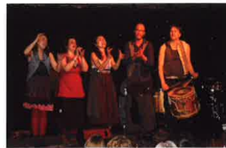
14 mars 2015 - Saint-Priest-la- Marche : Concert Chet Nuneta