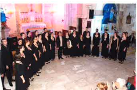
11 avril 2015 - Le Châtelet : Concert du Chœur de Chambre « Mikrokosmos »