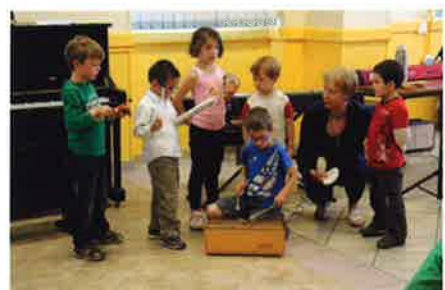
29 mai 2015 - Saint-Jeanvrin : Audition de l'école de musique MBM