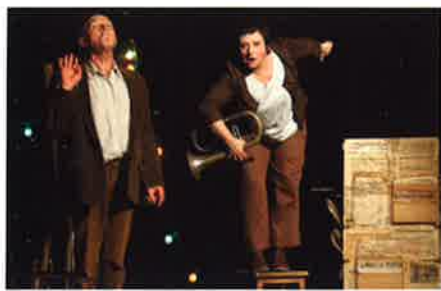
16 janvier 2015 - Rezay : Spectacle théâtre autour de Gaston Coûté « Le Semeur d'Allumettes »