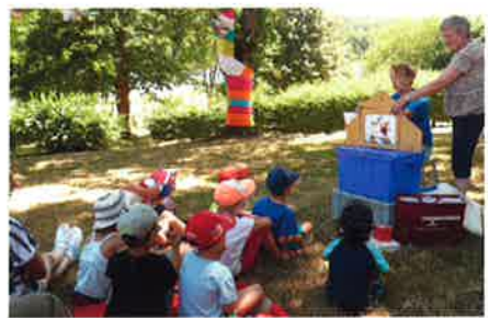
Juillet 2015 - Sidiailles : Bibliobus à la plage