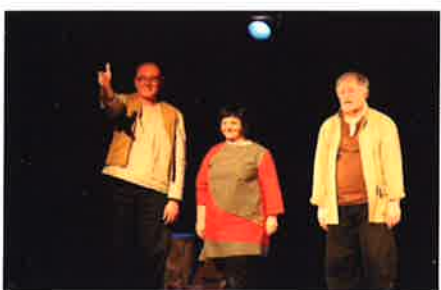
28 mars 2015 - Vesdun : Théâtre « Le Chemin des Âmes »