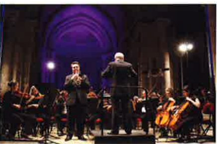
13 juin 2015 - Châteaumeillant : Orchestre Symphonique Régional